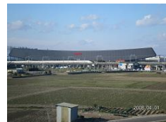
三洋電機(株)岐阜事業所