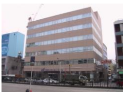
今池ゼネラルビル (名古屋)