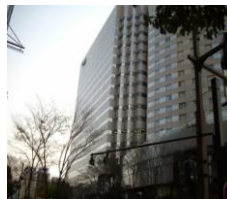
ヴィサーージュビル