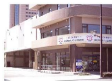
浜松市観光バス駐車場(浜松)