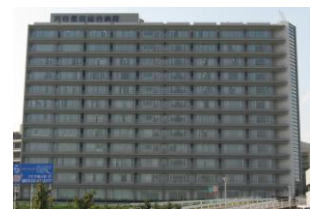
刈谷豊田総合病院