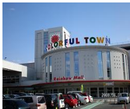
カラフルタウン岐阜