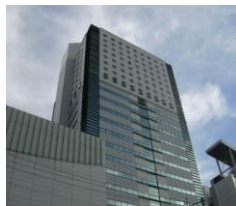
サウスポット静岡