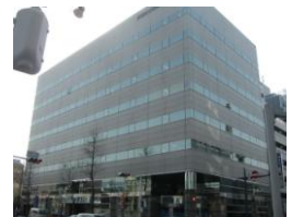
県信松本深志ビル