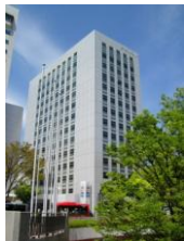
浜松第一生命日通ビル