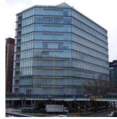
三井生命名古屋ビル