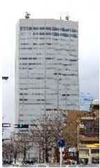
名古屋国際センタービル