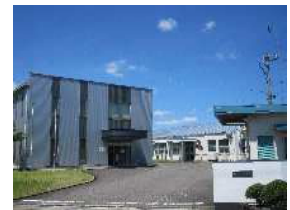
パイロット東郷工場