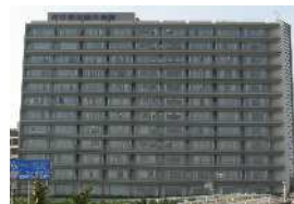
刈谷豊田総合病院