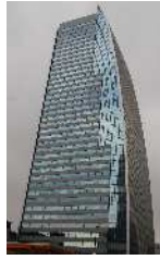
名古屋ルーセントタワー